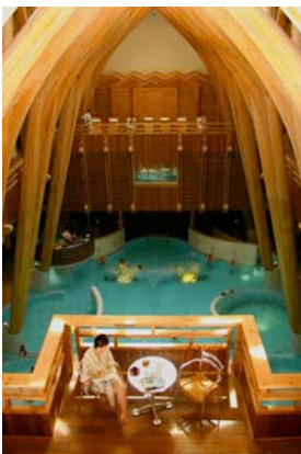
Aquensis, spa thermal à Bagnères-de-Bigorre