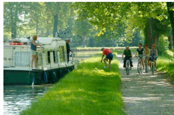
La voie verte du Canal des Deux Mers : 121 Km en Midi-Pyrénées