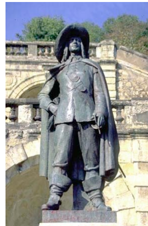
A Auch, Grand Site de Midi-Pyrénées, la statue de D'Artagnan

Descriptif détaillé : www.af3v.org/-Midi-Pyrenees-.html