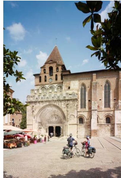
Moissac, Grand Site de Midi-Pyrénées, étape de la voie verte du Canal des Deux Mers