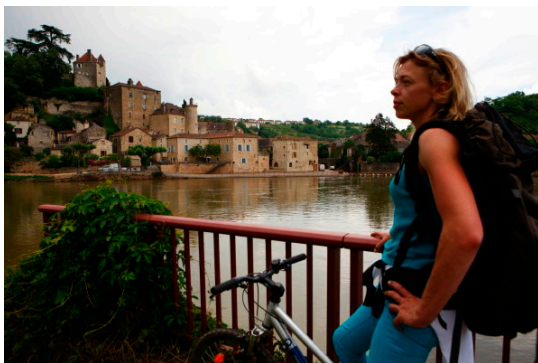
Puy-L'Évêque, étape de la véloroute de la vallée du Lot